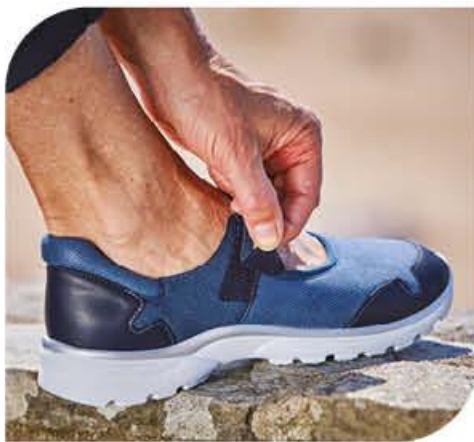
Bride auto-agrippante élastiquée

Contrefort extérieur renforcé pour maintenir le talon