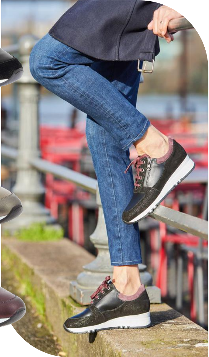
JOLLY Noir, Bronze, Bordeaux 36 - 41