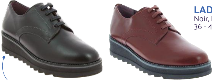
LADY Noir, Bordeaux 36 - 41

Pour affronter les défis quotidien avec élégance