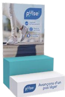
Présentoir 2 étagères